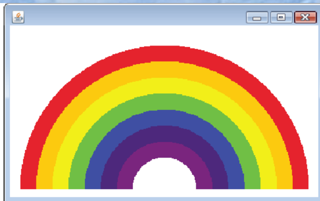
Figura 7.26 | Criando JFrame para exibir um arco-íris. (Parte 2 de 2.)